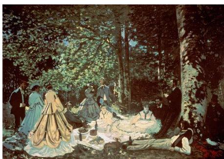
Claude Monet (1840-1926), étude pour Le Déjeuner sur l'herbe , Moscou, musée des Beaux-Arts Pouchkine